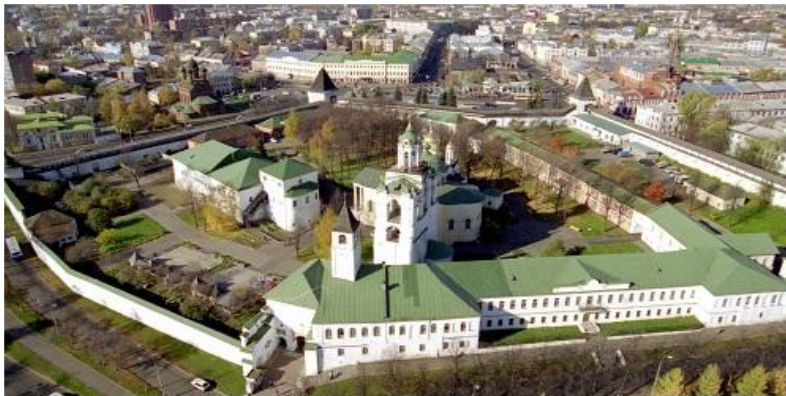
Спасо – Преображенский монастырь