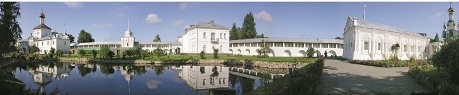
Свято-Введенский Толгский женский монастырь