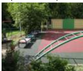
Создание площадок с резиновым покрытием