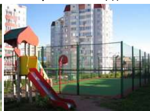
Создание детских городков и спортивных площадок